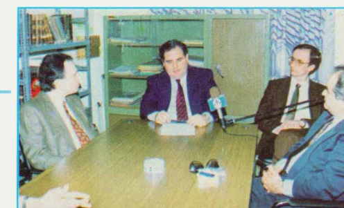
Εξαγγελία Δικαστικού Μεγάρου Θήβας