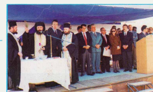
Θεμελίωση εργατικών κατοικιών Θήβας