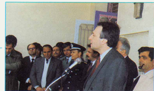
Εγκαίνια του Γυμνασίου στον Άγιο Δημήτριο