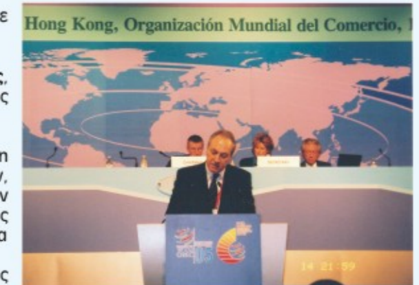
HONG KONG: 2005, Σύνοδος Παγκόσμιου Οργανισμού Εμπορίου (Π.Ο.Ε.)

Όλες οι προσπάθειές μας απέβλεπαν και αποβλέπουν στην ενδυνάμωση της ελληνικής υπαίθρου , με την ανάδειξη των συγκριτικών πλεονεκτημάτων της γεωργίας μας και την ενίσχυση της ανταγωνιστικότητας. Στόχος μας ήταν και είναι να διασφαλιστεί μακροχρόνια το εισόδημα των Ελλήνων παραγωγών.