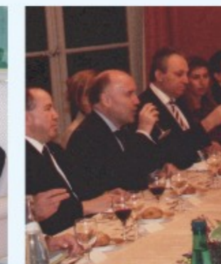
ΠΑΡΙΣΙ: Με το Γάλλο Υπ. Γεωργίας κ. Μπουσρώ