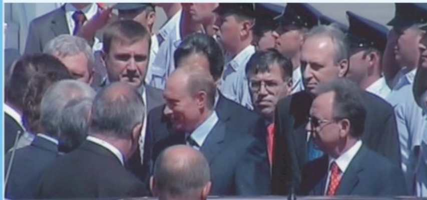
Απο την υποδοχή του Προέδρου της Ρωσίας κ. Βλ. Πούτιν