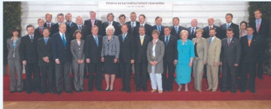
ΥΠΟΥΡΓΟΙ ΓΕΩΡΓΙΑΣ ΕΥΡΩΠΑΪΚΗΣ ΕΝΩΣΗΣ