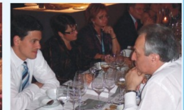
Με τον Υπ. Εξωτερικών της Μ. Βρετανίας κ. Ντ. Μίλλερμαντ

Ανάλογες θετικές εξελίξεις σημειώθηκαν στον αγροτικό τομέα μας απ' τον Σεπτ. 2007 ως τώρα, εξασφαλίζοντας δυνατότητες και προοπτικές για την Ελληνική Περιφέρεια