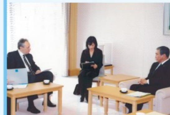
ΤΟΚΥΟ: Με τον Πρόεδρο της Ιαπωνικής Βουλής κ. Υ. Κόνο